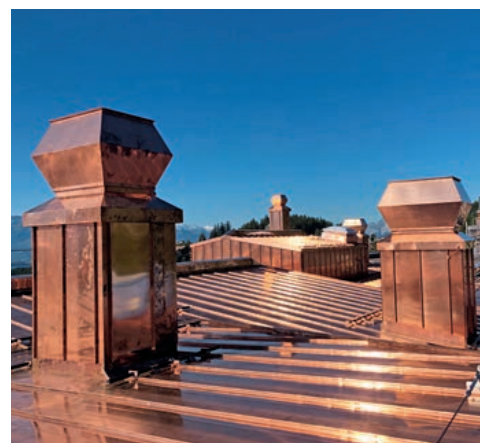
Un formidable travail accompli par les architectes et les couvreurs : le nouveau toit en cuivre de la Clinique Bernoise Montana.

Grâce à l'expérience de la première étape, les travaux ont pu être réalisés rapidement et de manière ciblée. Malgré quelques jours de pluie, la deuxième étape a pu être achevée plus tôt que prévu. Le toit de la clinique brille de nouveau de mille feux et restera resplendissant pour, nous l'espérons, les 70 années à venir.