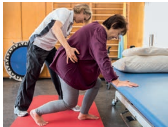
Premier objectif de réadaptation: retrouver sa capacité de fonctionnement au quotidien.