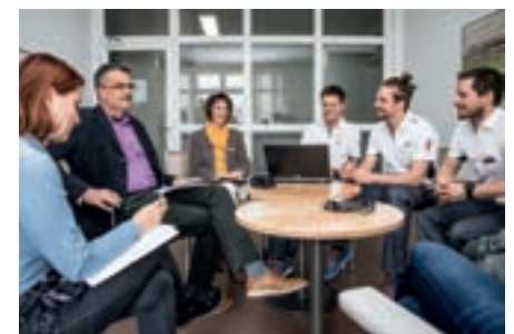
Le patient au centre des préoccupations : à la Clinique Bernoise Montana, une équipe interdisciplinaire établit et discute avec bienveillance et professionnalisme des chemins cliniques de chaque patiente et patient.

Tous ces chemins cliniques comportent une large prise en charge par les soins, la physiothérapie, la psychothérapie et l'ergothérapie. L'objectif est un suivi psychologique étroit des patientes et patients.