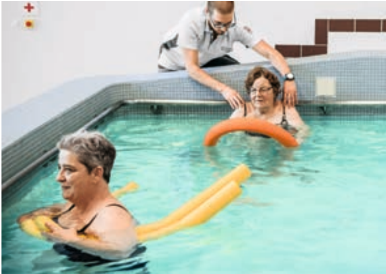
La Clinique Bernoise Montana propose des activités physiques très diverses. L'objectif est l'entraînement autonome, et il est encouragé.

Quand le corps est-il tendu ? Le biofeedback permet de le visualiser.